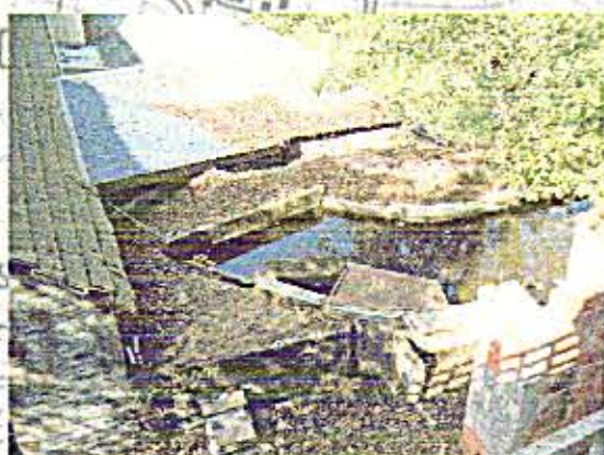
Photo 2 : Usine inondée en 1999 suite à la reconstruction du bief. En 1968 l'usine Labrun est inondée suite à une déformation du bief.