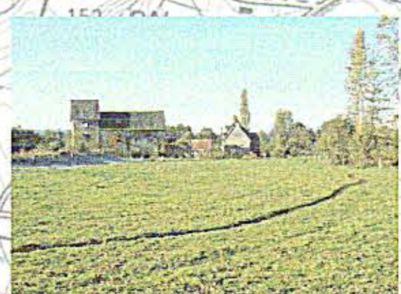
Photo 4 : Maison régulièrement inondée, entre 30 et 40cm d'eau en 1990.