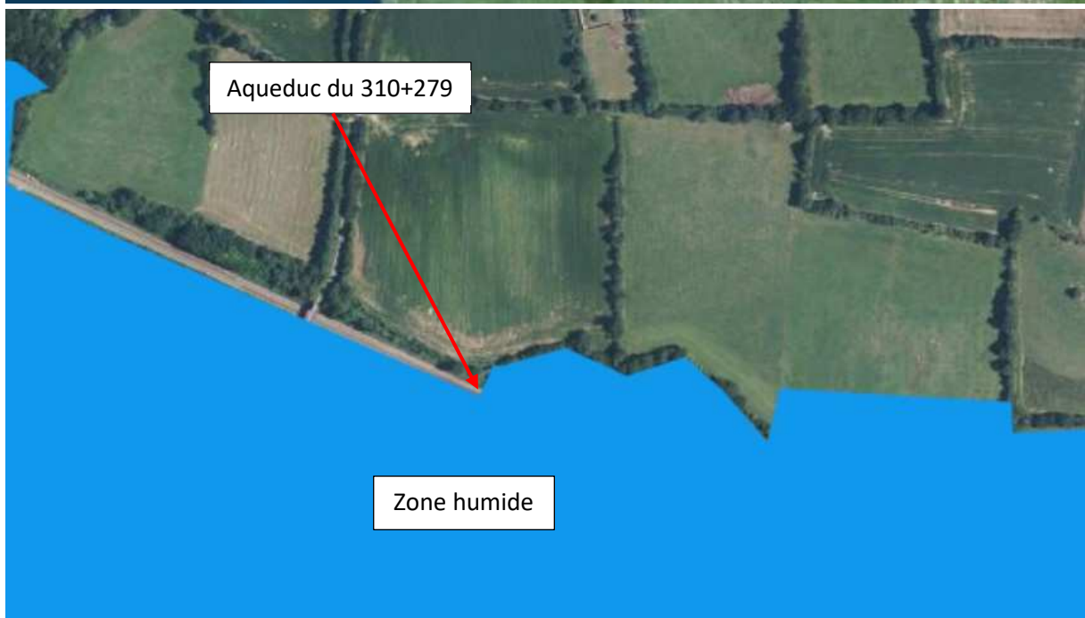
Figures 1 et 2 : Zone humide à proximité du projet